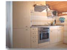
Küchenzeile mit Essecke